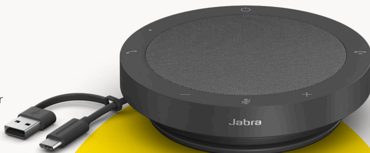
MS TEAMS- OG UC-VARIANTER

Vi tager nøje hensyn til bæredygtighed i alle led af produktudviklingen for at passe på vores planet. Derfor er kabinettet på Speak2 40 fremstillet af mere end 50 % bæredygtige materialer**, og den har en række indbyggede dele, der kan repareres eller udskiftes. Bedre bæredygtighed = længere levetid på højttaleren = flere kvalitetsopkald for dig og dit team – langt ind i fremtiden.