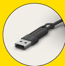
Kabel med USB-C og USB-A inkluderet