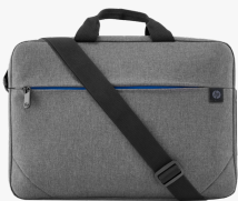
HP Prelude 15,6" taske til laptop 2Z8P4AA