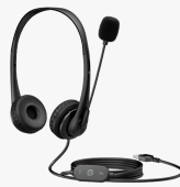
HP USB-stereoheadset G2 428H5AA