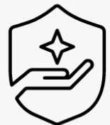
3 års afhentning og returnering U1PS3E