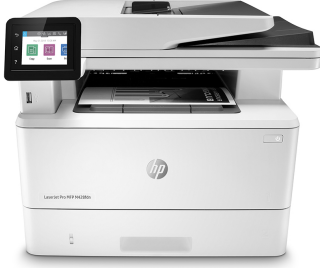
HP LaserJet Pro MFP M428fdn

İşte kazanmayı sağlayan, daha akıllı çalışmaktır. HP LaserJet Pro MFP M428, zamanınızı işlerinizi geliştirmenizi ve rakiplerinizden önde olmanızı sağlayacak en etkili unsurlara odaklamanız için tasarlandı.