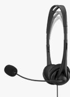
HP Stereo-Headset (3,5 mm) G2 428H6AA