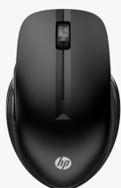
HP 430 Wireless-Maus für mehrere Geräte 3B4Q2AA