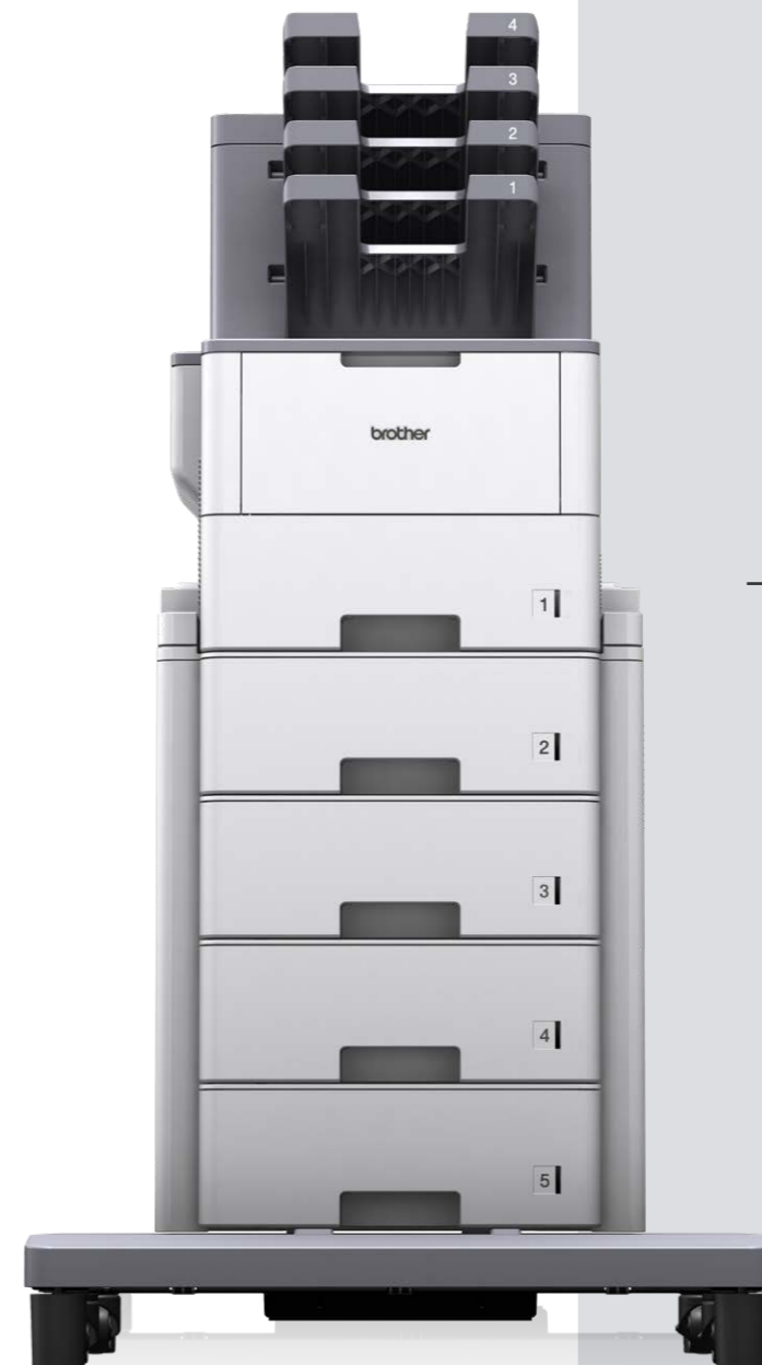
HL-L6400DW plus TT4000-skuffesystem og MX4000-mailboks