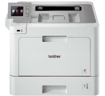
HL-L9310CDW TC4000 Connector