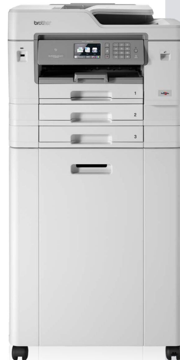
MFC-J6947DW plus skab