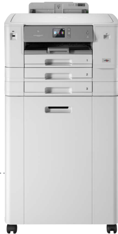
HL-J6100DW plus skab