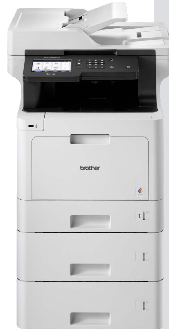
MFC-L8900CDW plus 2 x LT340CL skuffer