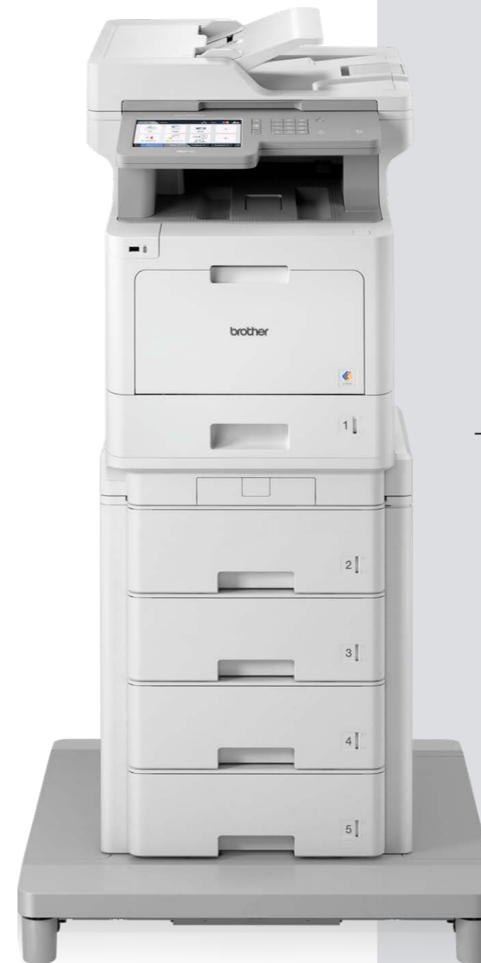
MFC-L9570CDW plus TC4000-connector og TT4000-mailboks