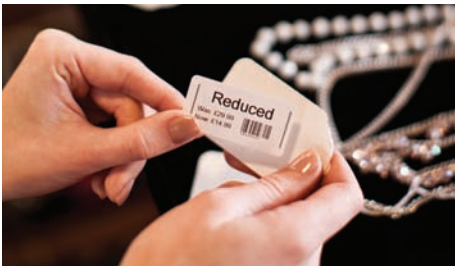
Sæt gang i salget ved at lave nye prismærker, mens du er ude i butikken.