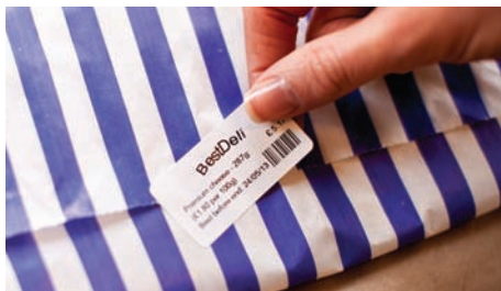
Klæbemiddelet i Brother RD-ruller er godkendt til mærkning af fødevarer.