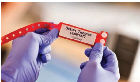
Print patientoplysninger efter behov