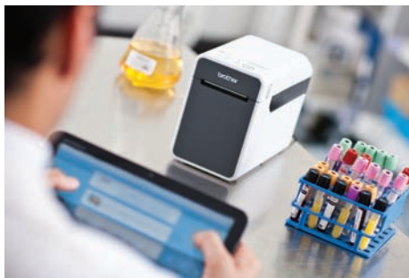
Større frihed og bevægelighed – print trådløst fra praktisk talt alle tablets eller håndholdte enheder

Det mobile software udviklings sæt gør det let for udviklere at integrere label- og bonprint i mobile apps. Der findes udviklings sæt til Apple™, Android™ og Windows Mobile™