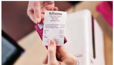
Giv dine kunder tydelige kvitteringer