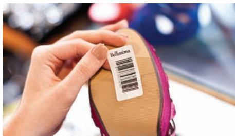
Du kan printe mange forskellige typer labels med TD-2000-serien

Brother RD-labels indeholder ingen Bisphenol-A, et almindeligt forekommende kemikalie i fremstillingen af andre labels. Brother RD-labels er sikre at anvende i fødevarerindustrien og udgør ingen fare for spædbørn og småbørn.