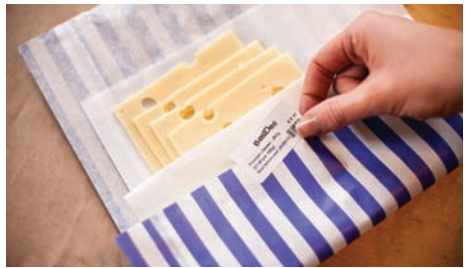
Gør kundernes mere trygge med tydelige "Anvendes inden"-labels