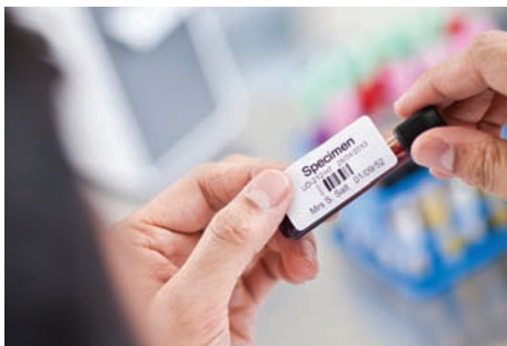
På sæt din skræddersyede label