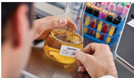
Sikrer, at patienternes prøver er tydeligt og korrekt opmærket