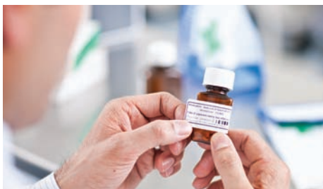
Labelstørrelser kan justeres, så de passer til piller i forskellige størrelser

Netværksmodellerne (2120N & 2130N) giver ansatte i sundhedsvæsenets mulighed for hurtigt trådløst print af stregkodelabels til laboratorier, apoteker, praktiserende læger eller hospitaler. Alle modellerne kan fremstille de mest almindelige stregkodelabels og er perfekte til alle labelopgaver inden for sundhedsvæsenet.