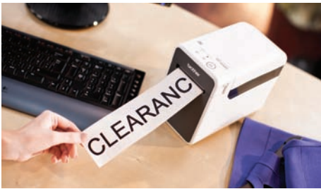
Med ruller i løbende bane er det muligt at fremstille større skilte - her og nu

TD-2000-serien har et kompakt design og er perfekt til brug på skrivebordet og disken i butikken uden at ofre værdifuld arbejdsplads til en stor, stationær printer. Skarp tekst, logoer og stregkoder kan hurtigt printes på Brother-media i høj kvalitet og er med til at forbedre kundetilfredsheden ved skranken eller kassen.