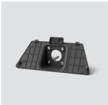
Steuerung - WM 01