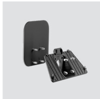
Steuerung WM - G