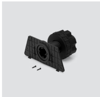
Control - DM 01