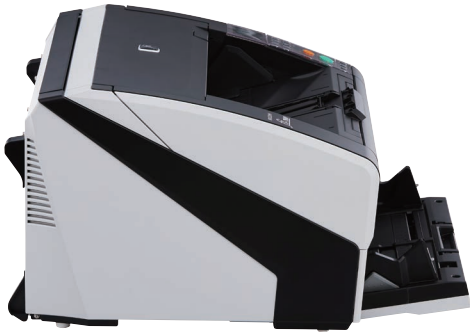
fi-7800 – A4 Paysage à 300 dpi 110 ppm / 220 ipm fi-7900 – A4 Paysage à 300 dpi 140 ppm / 280 ipm Scannez lots mixtes jusqu'à 500 feuilles