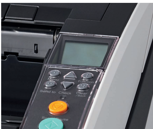
Écran à cristaux liquides intégré dans le panneau de commande

Les scanners fi-7800 et fi-7900 de Ricoh constituent une solution de numérisation complète. La combinaison de nos scanners, de nos logiciels et d'un service client qui compte parmi les meilleurs sur le marché vous fournit tout ce dont vous avez besoin pour améliorer la productivité de vos processus et libérer ainsi du temps pour vos collaborateurs. Vous pourrez ainsi mieux vous concentrer sur votre cœur de métier plutôt que sur la technologie.