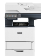
Imprimante multifonctions VersaLink® B625 de Xerox®*