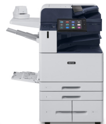
Imprimante multifonction AltaLink® B8145/ B8155/B8170 de Xerox®

* Produit non disponible dans toutes les régions, veuillez consulter votre représentant commercial.