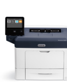
Imprimante Xerox® VersaLink® B400