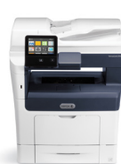
Imprimante multifonctions VersaLink® B405 de Xerox®