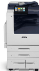
Imprimante multifonction VersaLink® B7125/ B7130/B7135 de Xerox®