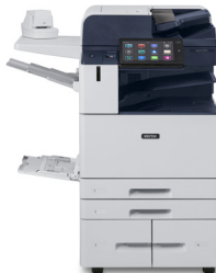
Imprimante couleur multifonction AltaLink® C8130/ C8135/C8145/ C8155/C8170 de Xerox®