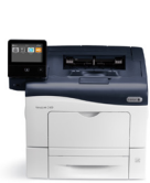
Imprimante couleur VersaLink® C400 de Xerox®