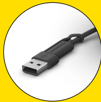
Connecteurs USB-C et USB-A fournis