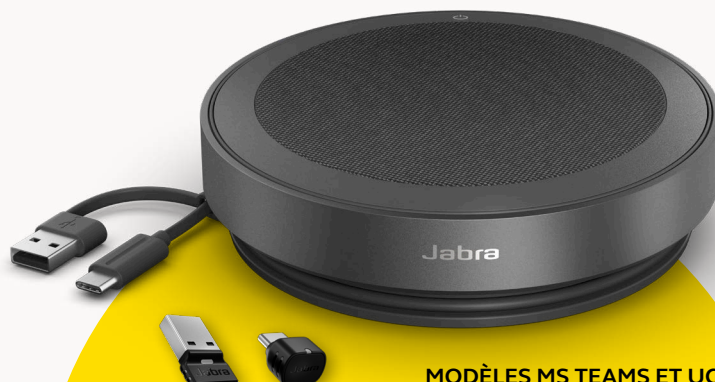
MODÈLES MS TEAMS ET UC

Pour apporter notre contribution à la protection de l'environnement, nous veillons à réduire notre empreinte écologique à chaque étape de la fabrication de nos produits. Le revêtement du Speak2 75 est composé de plus de 33 % de matériaux durables 3 et d'un nombre important de pièces réparables ou remplaçables. Voilà l'équation magique : préservation de l'environnement = durée de vie prolongée = qualité d'appels supérieure sur la durée, pour vous et votre équipe.