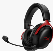
HyperX Cloud III Sans fil - Casque de jeu 77Z46AA