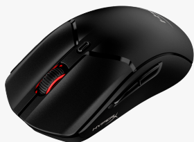
HyperX Pulsefire Haste 2 - Souris sans fil gaming (noir) 6N0B0AA