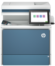
Imprimante multifonction HP Color LaserJet Enterprise 5800f

Cette imprimante a été conçue pour fonctionner uniquement avec des cartouches disposant d'une puce HP neuve ou réutilisée. Elle est équipée d'un dispositif de sécurité dynamique pour bloquer les cartouches intégrant une puce non-HP. Les mises à jour périodiques du micrologiciel permettent d'assurer l'efficacité de ces mesures et bloquent les cartouches qui fonctionnaient auparavant. Une puce HP réutilisée permet d'utiliser des cartouches réutilisées, reconditionnées ou recyclées. Plus d'informations sur: http://www.hp.com/learn/ds