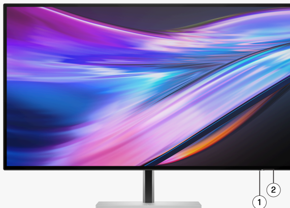
1. Bouton d'alimentation