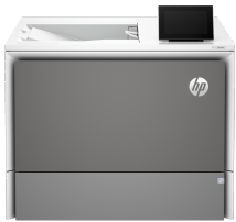
Imprimante HP Color LaserJet Enterprise 5700dn

Cette imprimante a été conçue pour fonctionner uniquement avec des cartouches disposant d'une puce HP neuve ou réutilisée. Elle est équipée d'un dispositif de sécurité dynamique pour bloquer les cartouches intégrant une puce non-HP. Les mises à jour périodiques du micrologiciel permettent d'assurer l'efficacité de ces mesures et bloquent les cartouches qui fonctionnaient auparavant. Une puce HP réutilisée permet d'utiliser des cartouches réutilisées, reconditionnées ou recyclées. Plus d'informations sur: http://www.hp.com/learn/ds