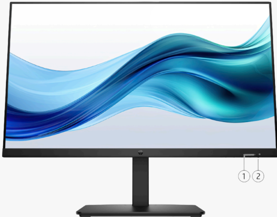
1. Voyant LED d'alimentation