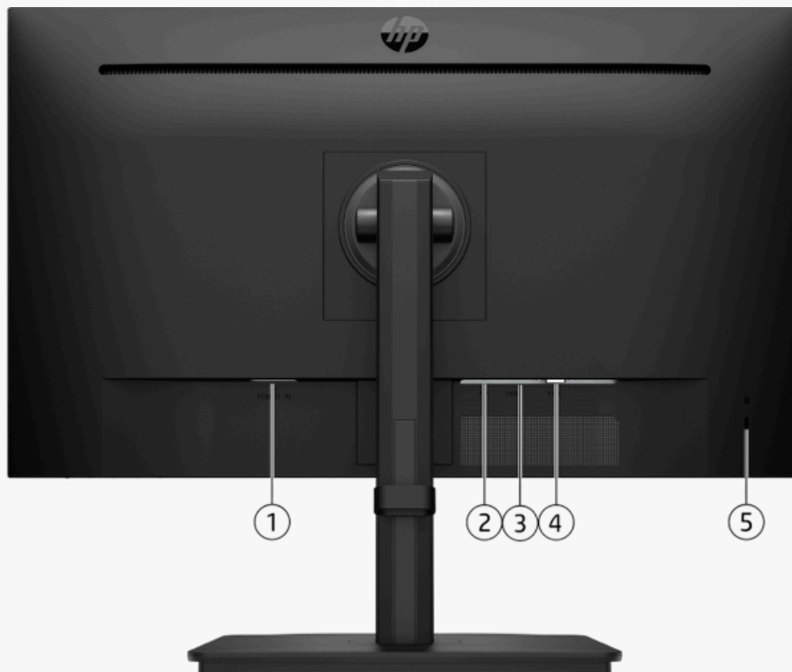
1. Connecteur d'alimentation 2. Port DisplayPort™ 1.2 3. Port HDMI 1.4