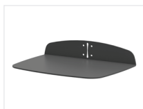
ÉTAGÈRE UTILITAIRE GRIS FONCÉ 97-507-282