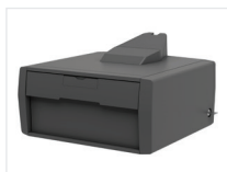
GRAND TIROIR SIMPLE GRIS FONCÉ 97-989-622

Accessoires supplémentaires disponibles en blanc