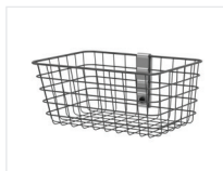
PETIT PANIER EN FER GRIS FONCÉ 98-136-282