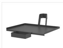
PLATEAU AVANT GRIS FONCÉ 98-417-282