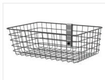
GRAND PANIER EN FER GRIS FONCÉ 98-135-282