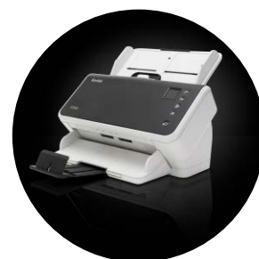
Scanners Kodak S2040/S2050/S2070