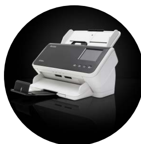
Scanners Kodak S2060w/ S2080w