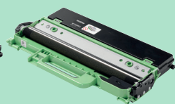
Bac de récupération de toner usagé WT229CL