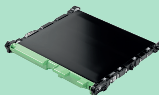
Courroie de transfert BU635CL