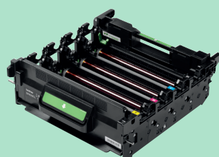
Unité tambour DR625CL