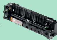
Unité de fusion FD-5000

Kit d'alimentation papier pour bac multifonction PF-M5000