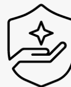
3 ans, enlèvement et retour U4812E