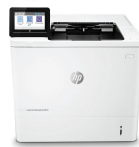
HP LaserJet Enterprise M610dn