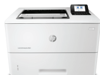
HP LaserJet Enterprise M507dn (1PV87A)