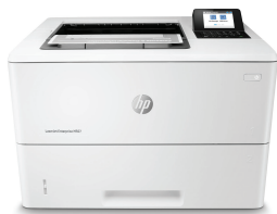
HP LaserJet Enterprise M507dn