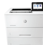
HP LaserJet Enterprise M507x (1PV88A)