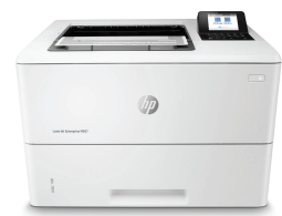
HP LaserJet Enterprise M507n