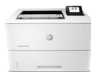
HP LaserJet Enterprise M507n (1PV86A)