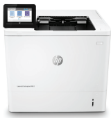
HP LaserJet Enterprise M612dn