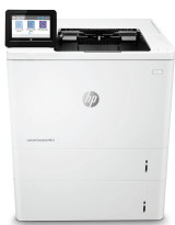
HP LaserJet Enterprise M612x