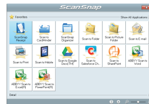
Menu rapide pour les fonctionnalités Mac OS et autres applications